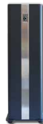
KEM 2000F Capacità 500 ml Copertura 5000 m 3