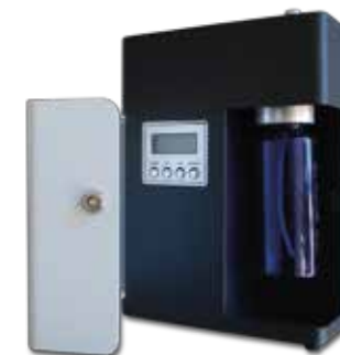
KEM 300NAF Capacità 200 ml Copertura 300/800 m 3