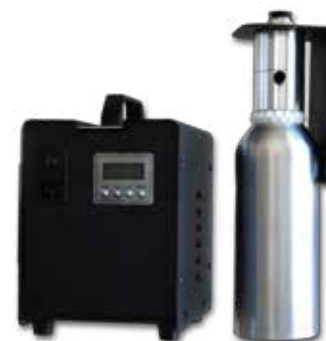
KEM 6000A Capacità 1 litro Copertura 6000/8000 m 3

Utilizzabili in spazi aperti o direttamente collegati agli impianti di climatizzazione.